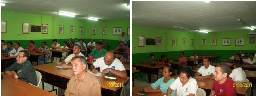
Docentes y personal administrativo del Recinto Central Participando en charlas de sensibilización del proceso de Autoevaluación UCN. Septiembre 2011