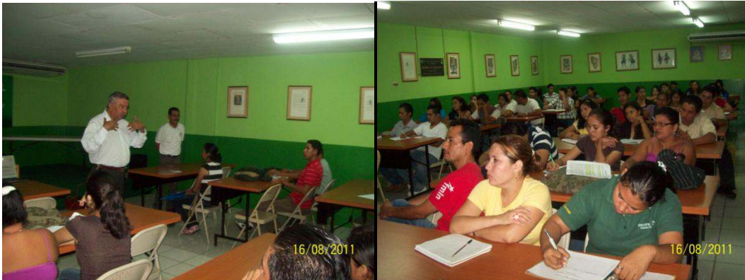
Estudiantes del Recinto Central Septiembre 2011

Charlas de sensibilización y Motivación dirigida a la comunidad universitaria.