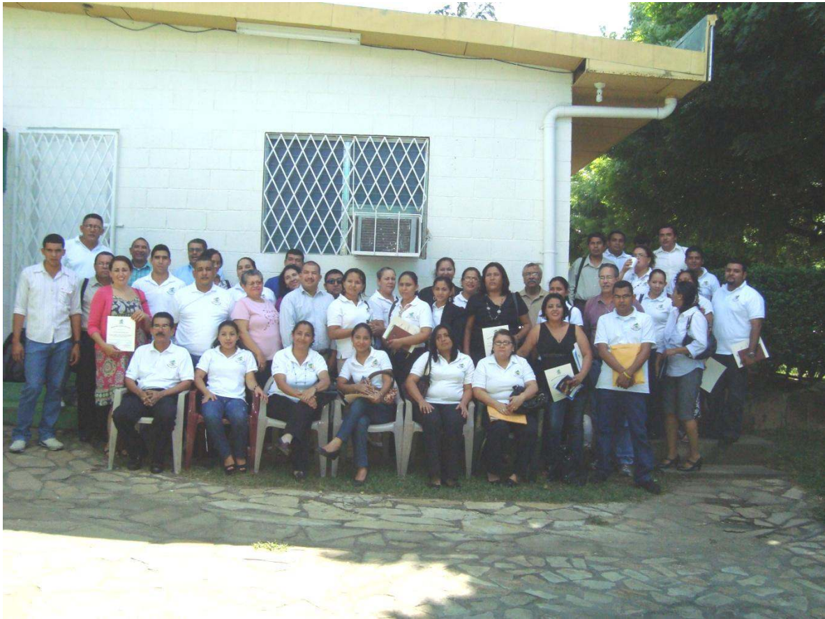
Miembros de Comisiones de Autoevaluación de los Recintos UCN 2012