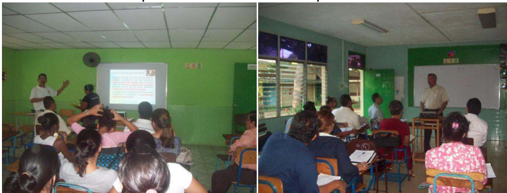
Docentes y estudiantes del Recinto Portezuelo Participando en charlas de sensibilización

del proceso de Autoevaluación UCN. Septiembre 2011