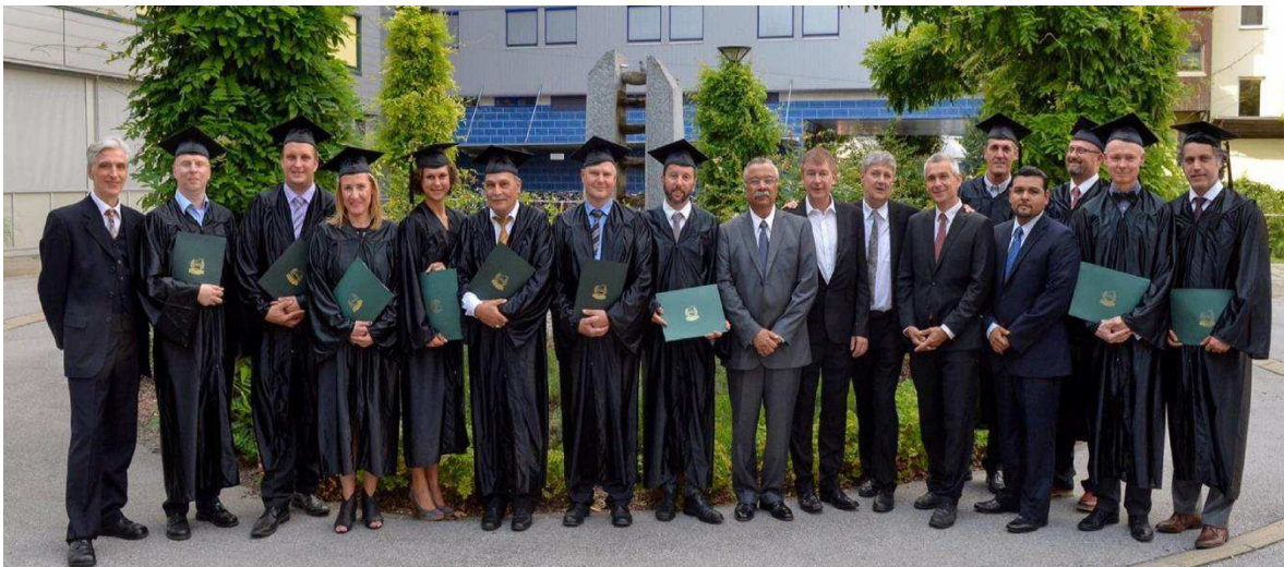
Graduación de UCN Maestrías y Doctorado en Administración Programas Internacionales año 2015. Innsbruck, Austria. (en la foto: Rector UCN, Graduandos y Docentes de UCN).