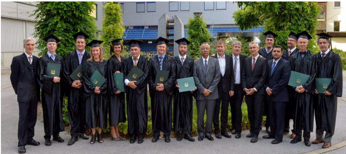
Graduación de UCN Maestrías y Doctorado en Administración Programas Internacionales año 2015. Innsbruck, Austria. (en la foto: Rector UCN, Graduandos y Docentes de UCN).